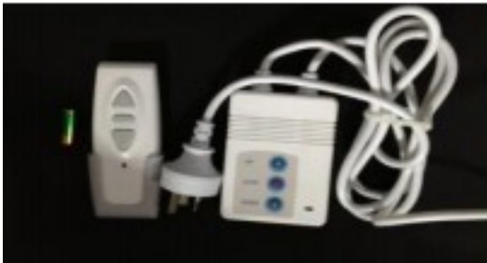
Télécommande infrarouge & boîtier de pilotage mural (Piles incluses)