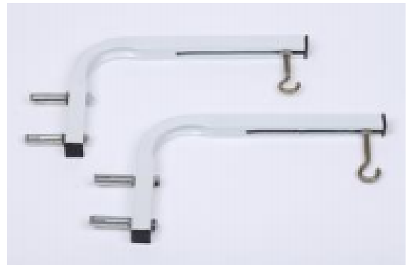
Support d'écran Mural/plafonnier